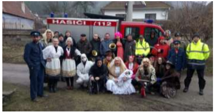
Skúška techniky v areáli SV. Huberta